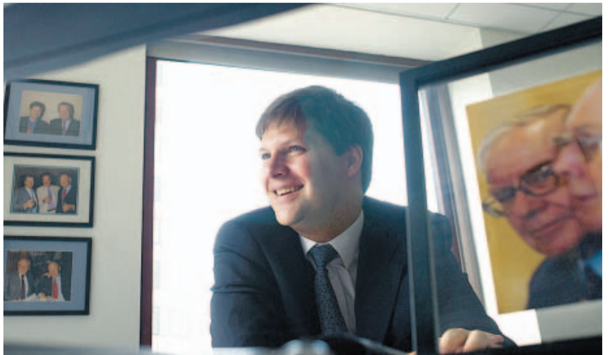
SULTEN. Hedgfondforvalter Guy Spier betalte tre millioner kroner for å spise lunsj med Warren Buffet.