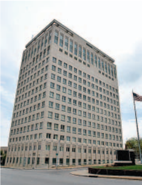
HK. Bygningen der Berkshire Hathaway har sine kontorer.