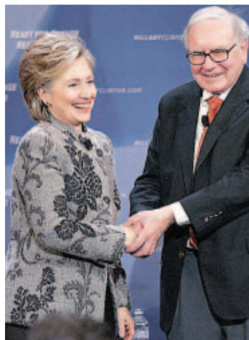
DEMOKRAT. Warren Buffett er demokrat, og har gitt sin støtte til både Hillary Clinton og Barack Obama.