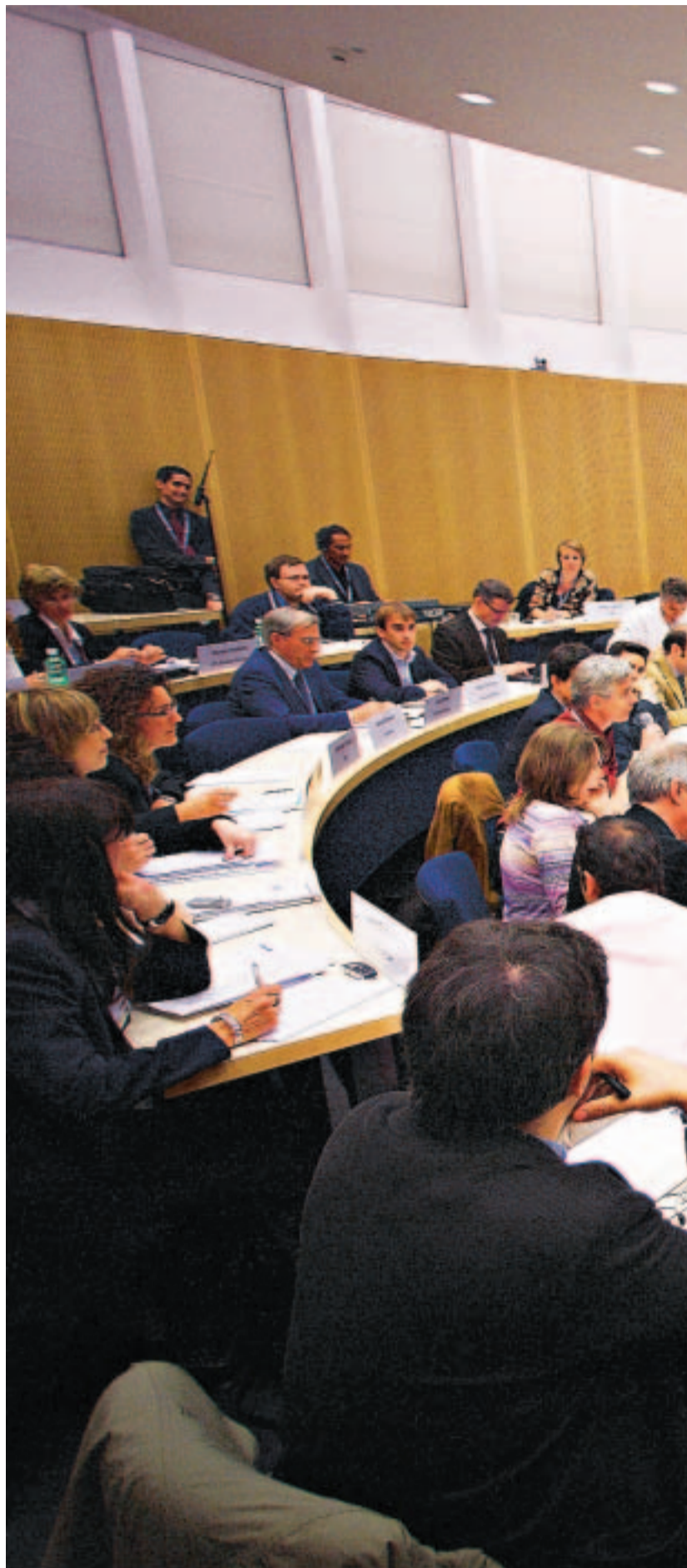
PÅ KJØPER'N. Denne uken møtte Warren Buffet pressen i sveitsiske Lausanne.

Oppover er det få grenser for Warren Buffett. Berkshire Hathaway skal ha rundt 300 milliarder kroner tilgjengelig for investeringer, seks ganger mer enn StatoilHydros driftsresultat i årets tre første måneder. Men også Buffett startet i det små.