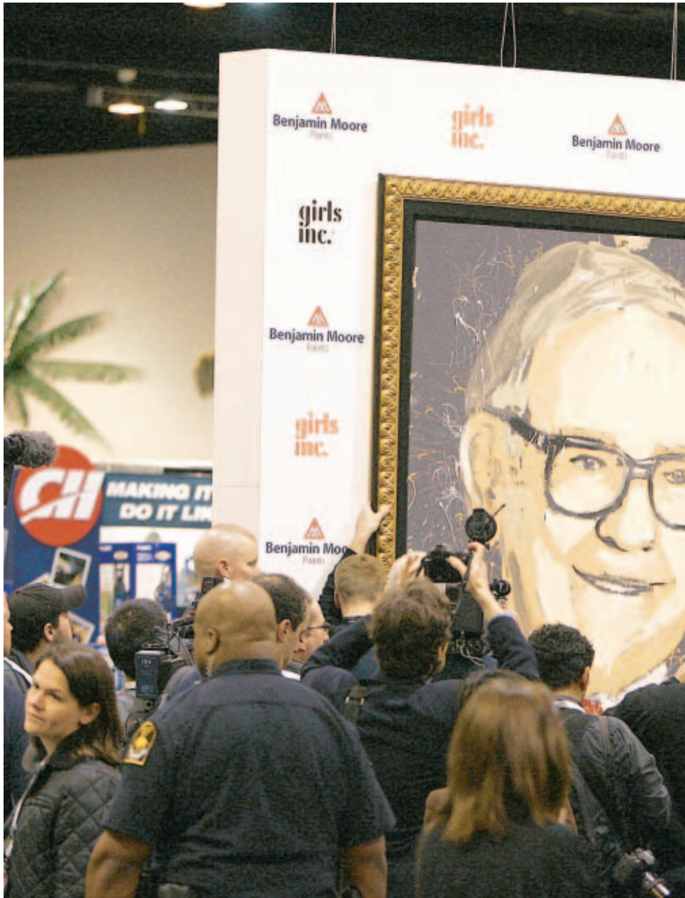
IKON. Under årets generalforsamling i Berkshire Hathaway kunne deltagerne skue dette portrettet av Buffett.

Nå står han gjeldfri og titter på et finans-