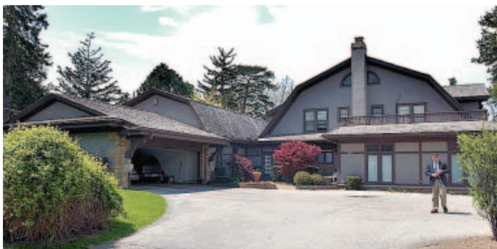
MODERAT. Warren Buffett har bodd i dette huset i Nebraska siden 50-tallet.